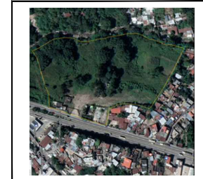
PLANO DE UBICACION ESCALA 1:10,000