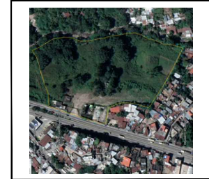
PLANO DE UBICACION ESCALA 1:10,000