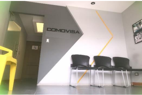
3 Auditoria / RRHH