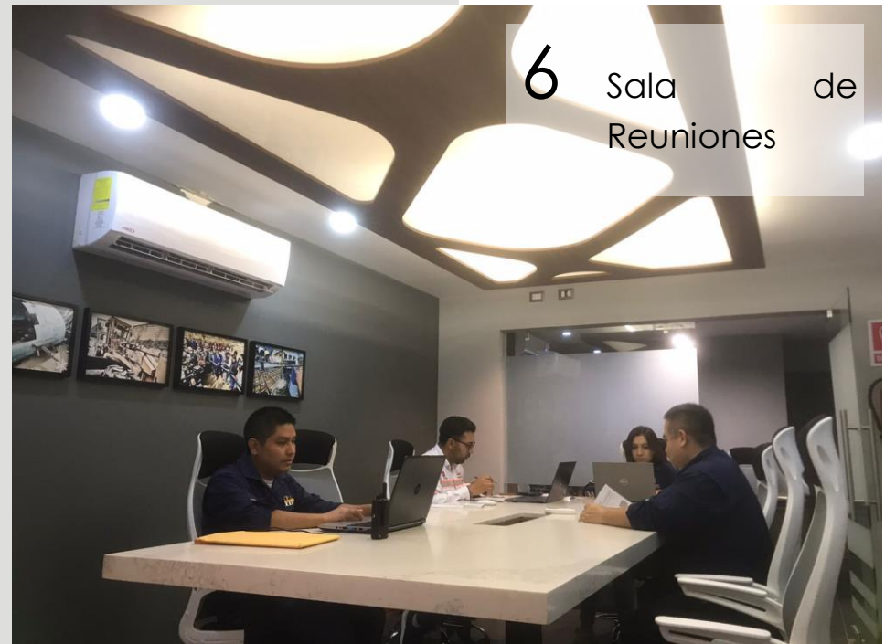
6 Sala de Reuniones